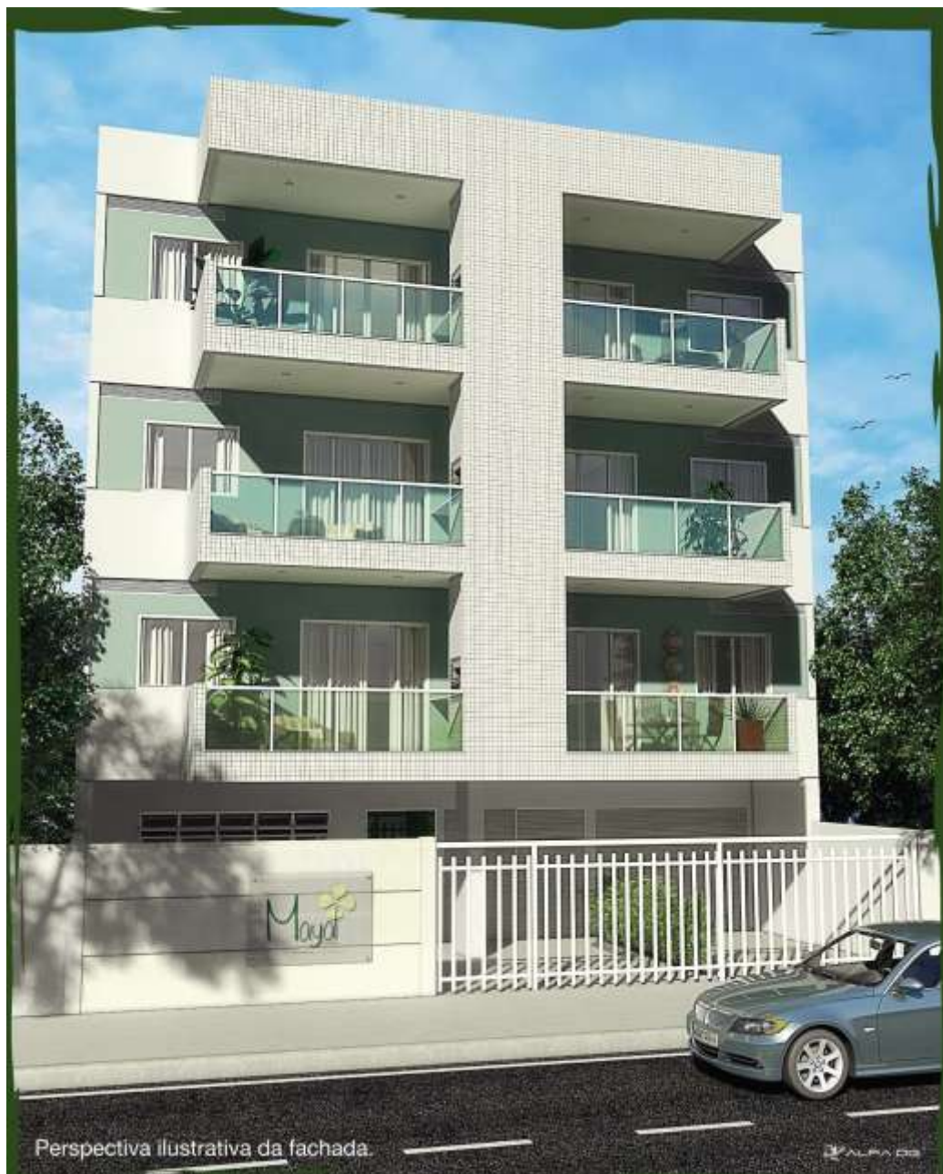
Perspectiva Ilustrativa da fachada.